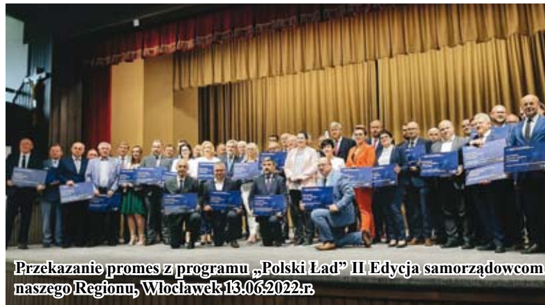
Przekazanie promesy z programu „Polski Ład” II Edycja samorządowcom naszego Regionu, Włocławek 13.06.2022.r.

Samorzady decydowały same na jakie inwestycje składają wnioski. Miałam przyjemność uczestniczyć w konsultacjach wielu z nich. To na-