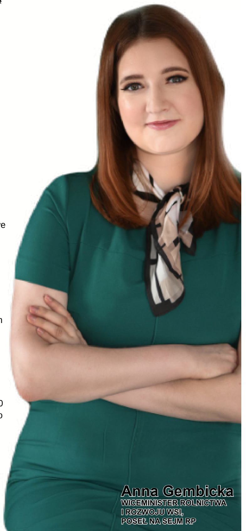
Anna Gembicka WICEMINISTER ROLNICTWA I ROZWOJU WSI, POSEŁ NA SEJM RP

Podsumowując chciałabym podkreślić, że wspólnie modernizujemy Polskę docierając z inwestycjami nawet do tych gmin i do tych powiatów, które przez lata po transformacji zmagaly się ze społecznym wykluczeniem. Nie ma i nie było zgody na Polskę dwóch prędkości, na dynamicznie rozwijające się centra i pozbawione szans peryferie. Cieszę się, że mogę brać udział w procesie odbudowy kraju w którym szanse na rozwój są równe dla wszystkich.