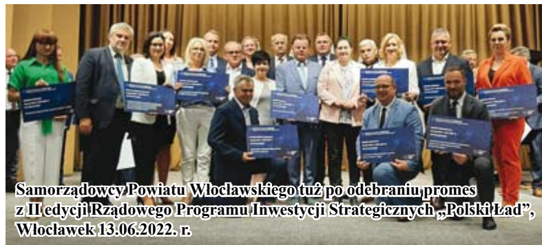
Samorządowcy Powiatu Włocławskiego tuż po odebraniu promesy z II edycji Rządowego Programu Inwestycji Strategicznych „Polski Ład”, Włocławek 13.06.2022. r.

Do Powiatu Włocławskiego trafi 11 milionów na rozbudowę drogi Lu-