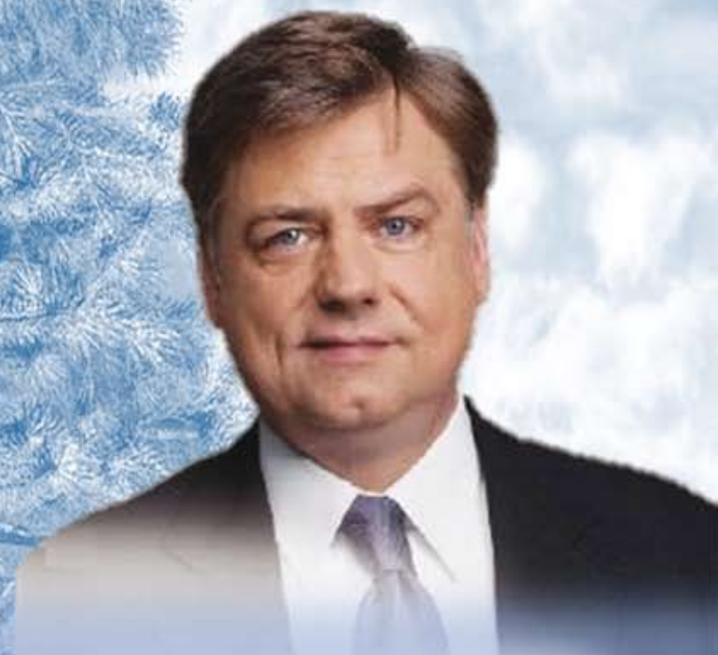
Kosma Złotowski Poseł do Parlamentu Europejskiego