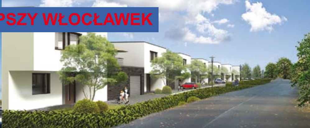
PRZYSZŁE MIESZKANIA OSIEDLE DLA SENIORÓW