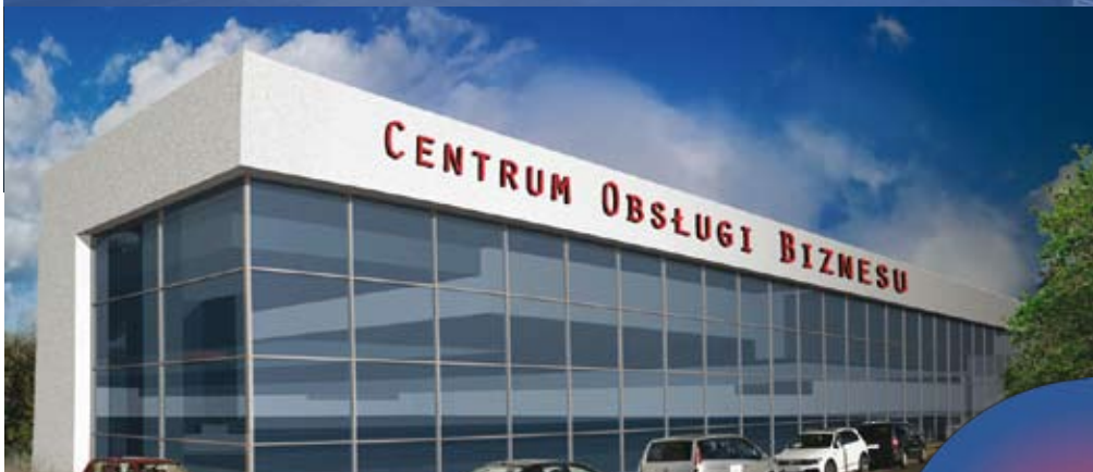
CENTRUM OBSŁUGI BIZNESU ROZWÓJ GOSPODARCZY