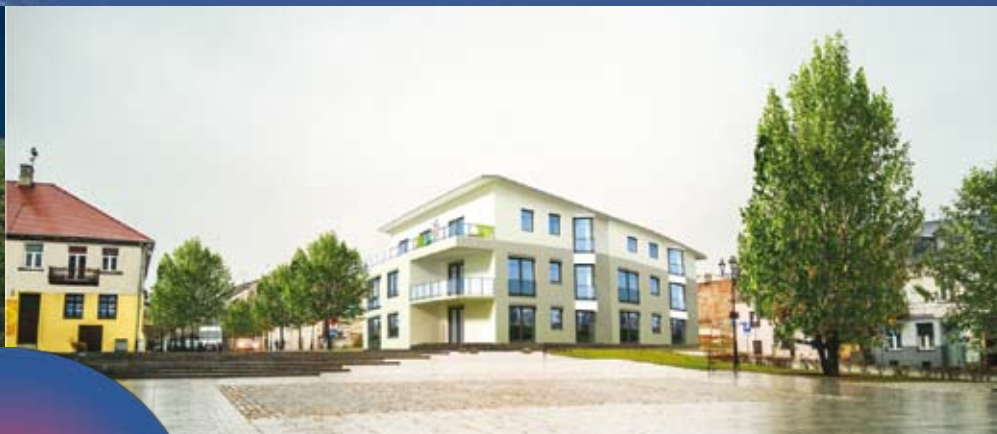
NOWOCZESNE ŚRÓDMIEŚCIE INTELIĞENTNE MIASTO