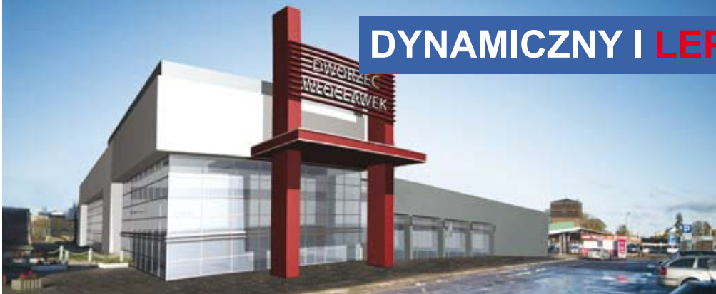
DWORZEC, NA KTÓRY CZEKAMY OTWARTY PRZEJAZD NA KALISKIEJ