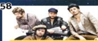
Kabaret Skeczów Męczących