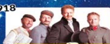
Kabaret Moralnego Niepokoju