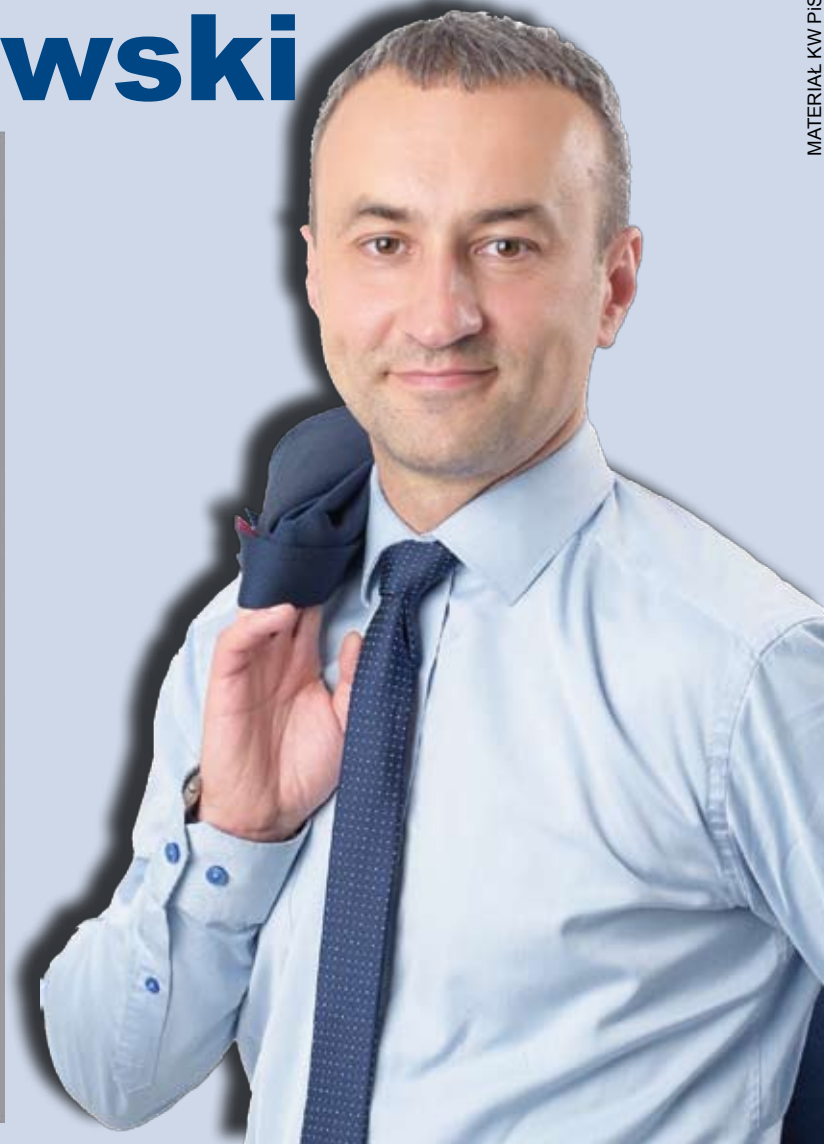
MATERIAŁ KW PIS