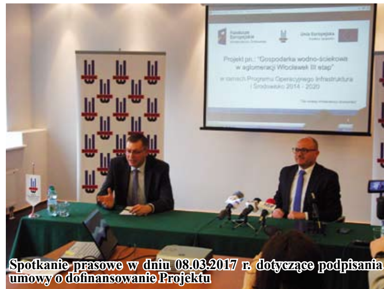
Spotkanie prasowe w dniu 08.03.2017 r. dotyczące podpisania umowy o dofinansowanie Projektu

- zapewnienie mieszkańcom dostępu do wysokiej jakości wody pitnej, spełniającej normy polskie i europejskie,