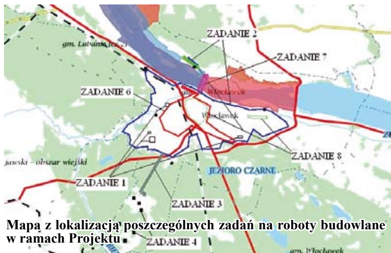
Mapa z lokalizacją poszczególnych zadań na roboty budowlane w ramach Projektu

nizację i rozbudowę systemu zarządzania i monitorowania infrastrukturą wod-kan., w tym m.in. rozbudowę i aktualizację oprogramowania GIS, zakup urządzeń GPS służących do zadań geodezyjnych w ramach systemu GIS oraz budowę i kalibrację modelu hydraulicznego sieci wodociągowej wraz z zakupem sprzętu komputerowego, oprogramowania, urządzeń pomiarowych do kalibracji modelu i monitorowania bieżących odczytów parametrów pracy sieci,