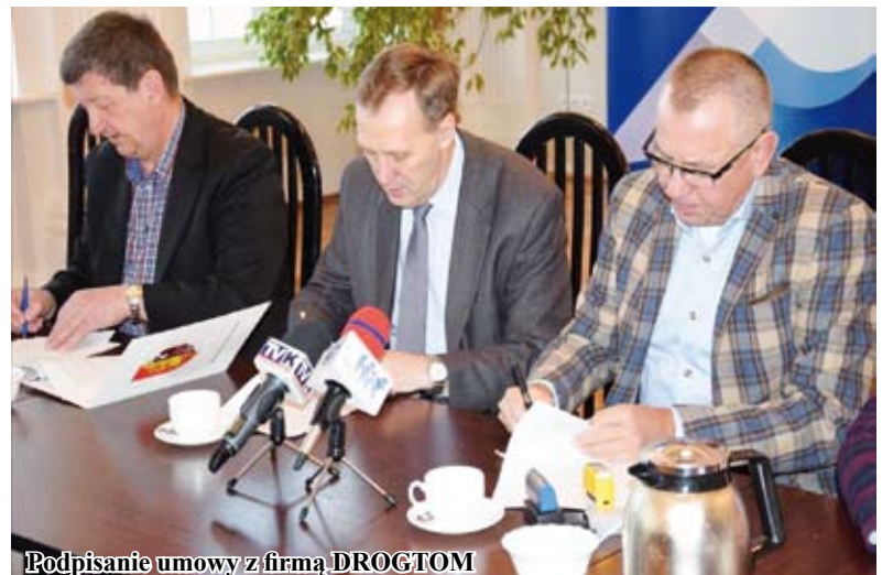
Podpisanie umowy z firmą DROGTOM