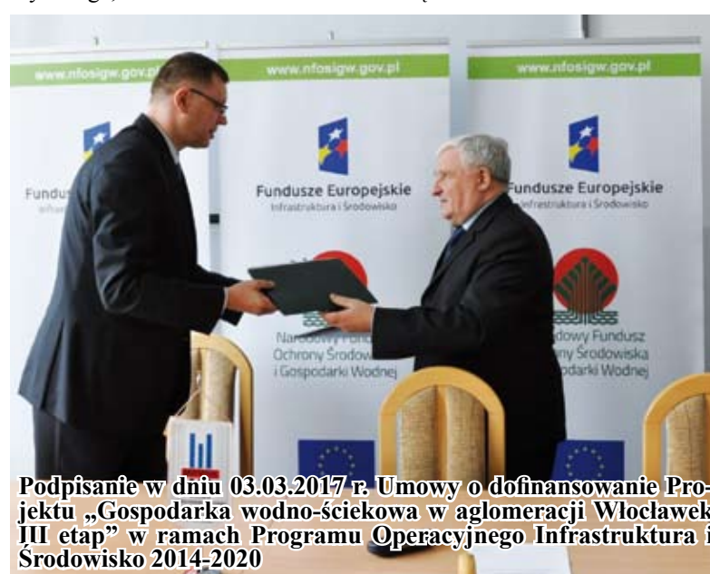
Podpisanie w dniu 03.03.2017 r. Umowy o dofinansowanie Projektu „Gospodarka wodno-ściekowa w aglomeracji Włocławek III etap” w ramach Programu Operacyjnego Infrastruktura i Środowisko 2014-2020

- Zadanie nr 6 obejmujące modernizację i przebudowę magistrali i sieci wodociągowych z przyłączami we Włocławku w ulicy Leśnej, Polskiej Organizacji Wojskowej, Kościuszki, Plac Wolności, Dojazdowej, Dziewińskiej, Nowomiejskiej oraz Wyszynskiego,