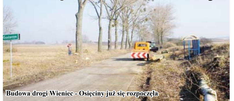
Budowa drogi Wieniec - Osiećciny już się rozpoczęła

Mimo chłodnej aury i niekorzystnych warunków atmosferycznych władze powiatu włocławskiego tak przygotowały inwestycje drogowe, że mogły ruszyć wraz z poprawą pogody.