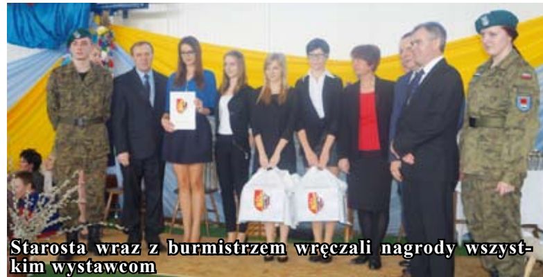
Starosta wraz z burmistrzem wręczali nagrody wszystkim wystawcom

Na wystawie, jak co roku pojawili się też twórcy ludowi, którzy prezentowali swoje rękodzieło.