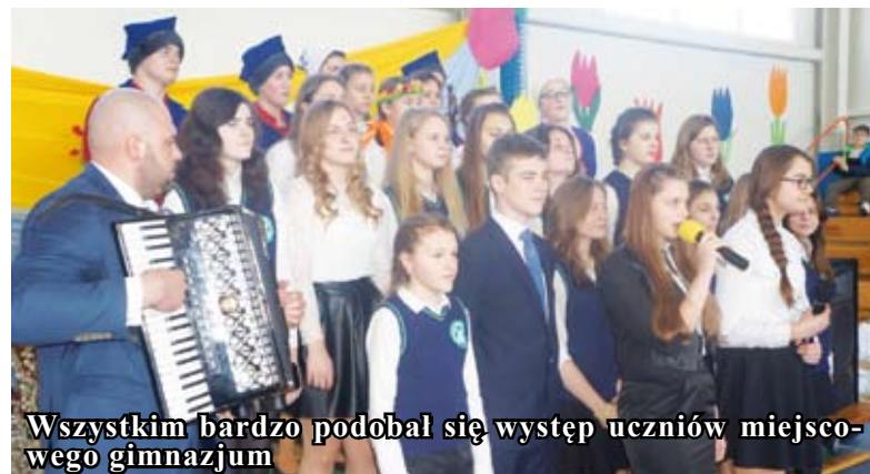
Wszystkim bardzo podobał się występ uczniów miejscowego gimnazjum