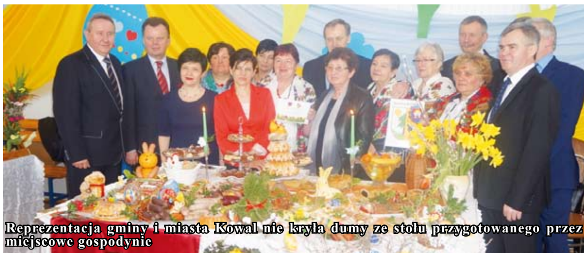
Reprezentacja gminy i miasta Kowal nie kryła dumy ze stołu przygotowanego przez miejscowe gospodynie