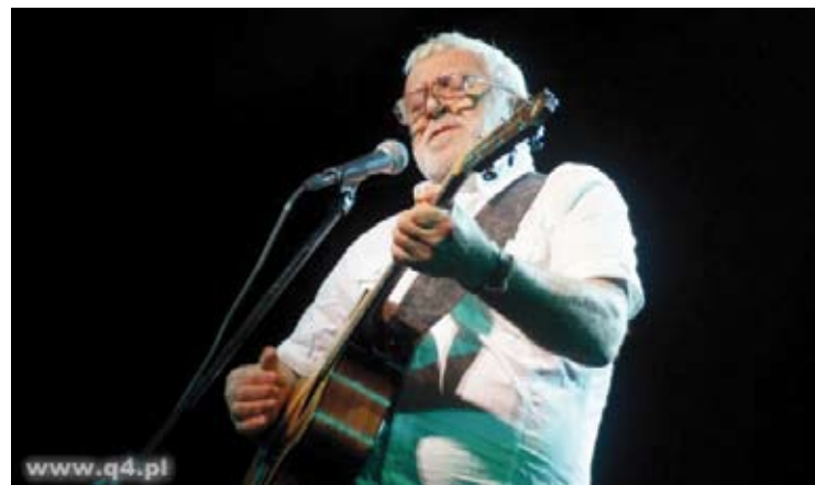
Legendarny angielski bluesowo-rockowy wokalista gościł 5 października we Włocławskim Browarze B.