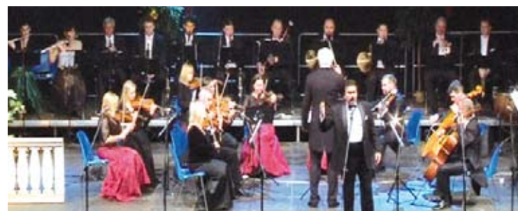
IV Festiwal Włoskiej Muzyki Operowej „Belcanto Per Sempre” za nami. Jak co roku wielbiciele muzyki poważnej mogli wysłuchać dwóch koncertów. Pierwszy odbył się w piątkowy wieczór (3 października) w Pałacu Bursztynowym, w trakcie którego wyłoniono laureatów Bursztynowej Struny, natomiast w sobotę (4 października) w Hali Mistrzów miał miejsce koncert galowy zatytułowany „Balla Voce”.

tem tego przedsięwzięcia jest młodzież. To jest bardzo ważne, by oświata, nauczyciele, policja, samorząd każdego szczebla, czy wszelkiego typu organizacje skierowane zostały na partnerstwo choćby piętnastolatka. I nie bać się im zaufać, co bardzo często oni są gotowi zastąpić nas w sytuacjach kryzysowych, w których nas nie ma w pobliżu.