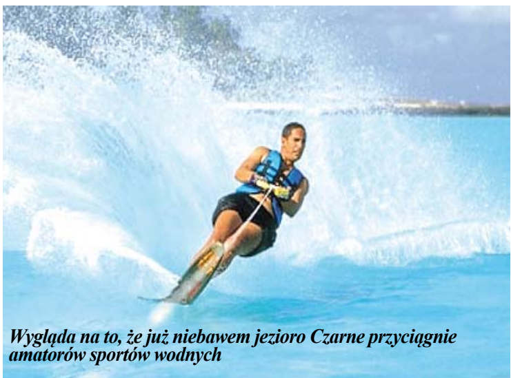
Wygłąda na to, że już niebawem jezioro Czarne przyciągnie amatorów sportów wodnych

OSiR wynajął teren wokół jeziora na trzy lata. Najemca zainwe-