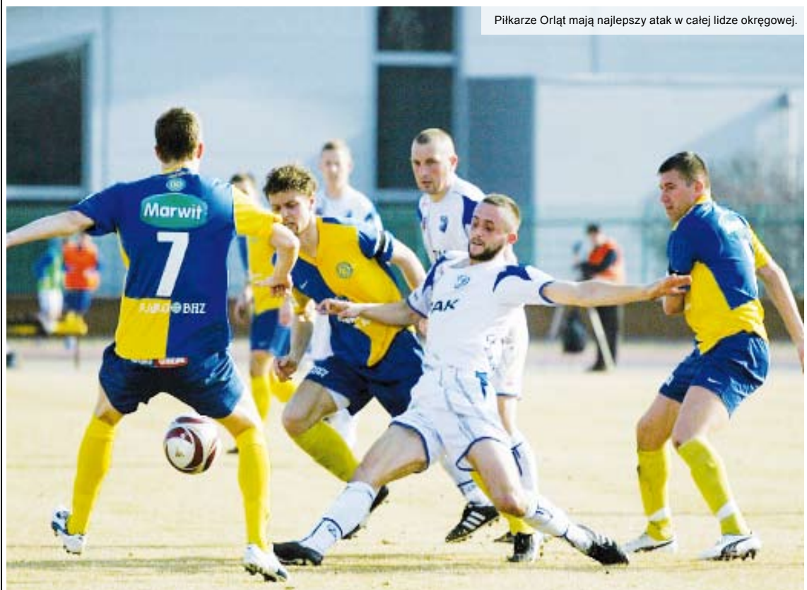
Piłkarze Orląt mają najlepszy atak w całej lidze okręgowej.