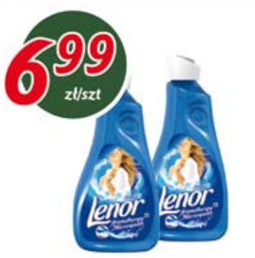
Płyn do płukania LENOR 1l