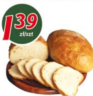
Chleb baltonowski 450g

era niskich cen zmieniamy się dla Ciebie!