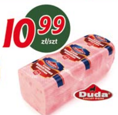
Szynka konserwowa DUDA